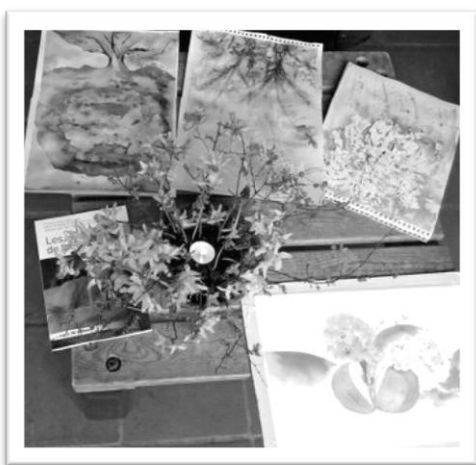
Aquarelles : réalisations de participants

La prière éclairée par la Parole deviendra couleurs Et chacun de nous pourra être révélateur pour l'autre du Tout Autre.